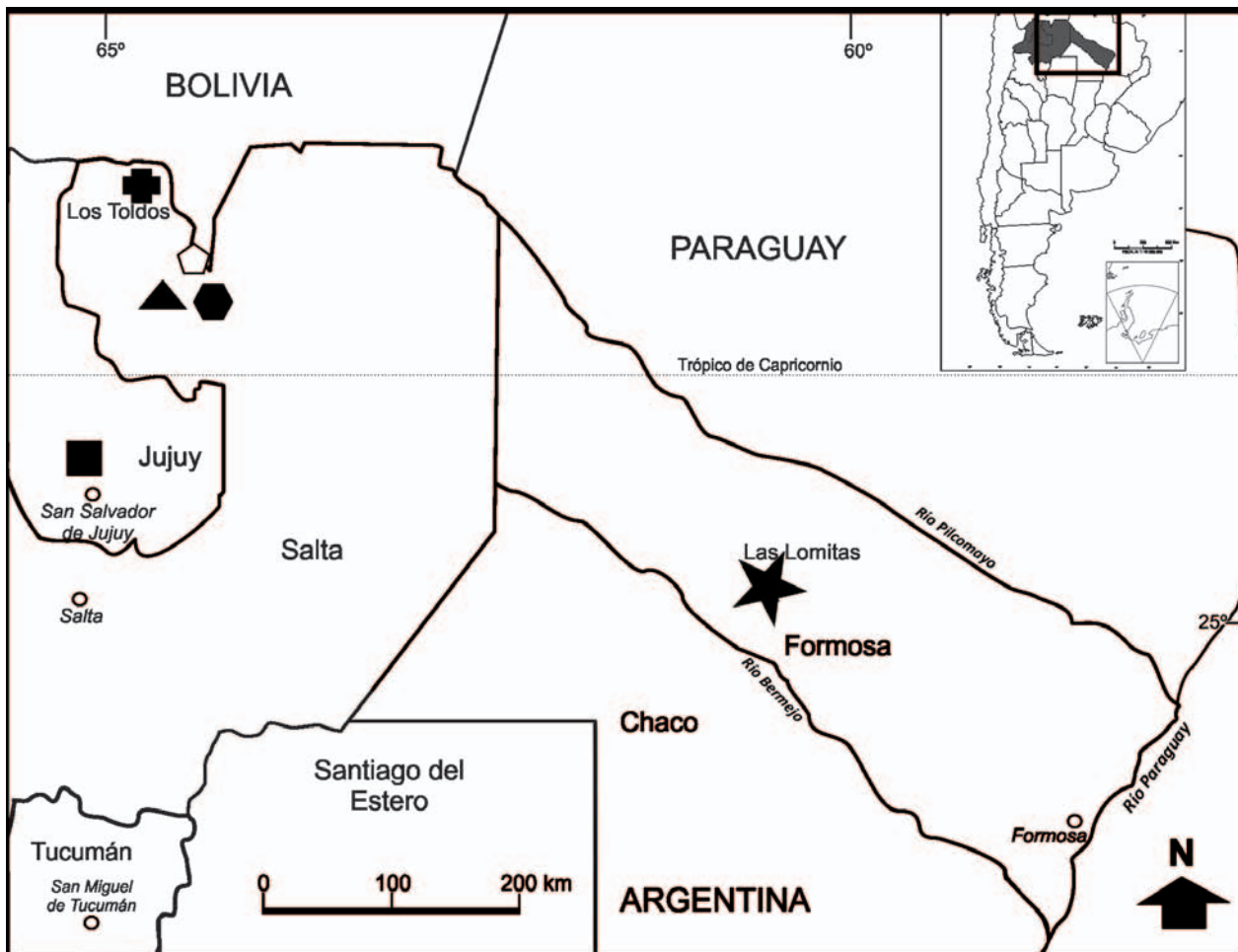
Figura 1. Mapa de distribución de Elachistocleis skotogaster en Argentina. Registros previos: Cruz negra - Localidad tipo, Los Toldos, Salta, Argentina (Lavilla, et al. 2003). Triángulo negro - Localidad cercana a Isla de Cañas, Salta, Argentina (Cajade et al. , 2009). Hexágono negro - Sitio cercano al Río Piedras, Salta, Argentina (Cajade et al. , 2009). Pentágono blanco - Punto cercano a Aguas Blancas, Salta, Argentina (Cajade et al. 2009). Cuadrado negro - Paraje El Duraznito, Departamento General Manuel Belgrano, Jujuy, Argentina (Pereyra y Akmentins, 2011). Estrella negra - Nuevo registro (Establecimiento Sumayen 2000, Las Lomitas, Formosa, Argentina).

hasta la inserción de las extremidades anteriores. Ventralmente se observa un pliegue torácico (Fig. 2C) que se extiende hasta la zona de inserción de los miembros posteriores. Lateralmente se observa un notable pliegue que va desde la región timpánica hasta la inserción de los miembros posteriores (Figs. 2D y E). Los ejemplares presentan una franja de color naranja en la superficie oculta de los miembros posteriores (Fig. 2A). También presentan manchas irregulares de color naranja en la ingle (Figs. 2A, D y E) y en la región axilar (Fig. 2E), coloración que se mantiene luego de cuatro meses en formol al 10%, sin embargo, es evidente que el anaranjado va tornándose blanquecino (Fig. 2E), tal como lo mencionan Lavilla et al. (2003). El vientre es gris con manchas blancas (Fig. 2C). La garganta es de color gris un tanto más oscuro con manchas blancas (Fig. 2C). Se observan también manchas de color amarillo pálido en la región comisural, en el pecho y en la